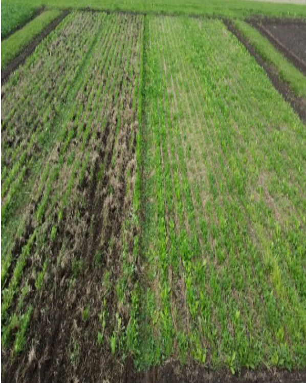
Billede 3 Slæbeskade i efterafgrøden i forbindelse med radrensning (klik på billedet for stor udgave).