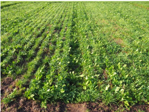
Billede 4 Efterafgrøde ca. en måned efter radrensning og slæbeskade (billede 2). (Klik på billedet for stor udgave).